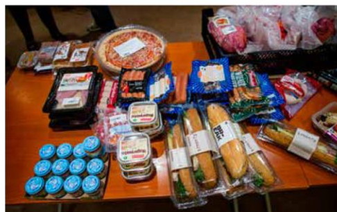
Denne maten hadde gått i søpla om ikke Frikirken hadde hentet den i butikker og delt den ut.

– Vi ber folk om å lukte litt på kjøtt- og melkeprodukter, men de fleste varer holder lenge utover