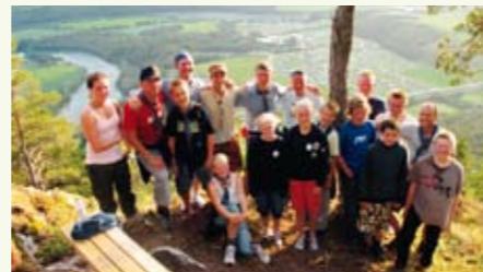
Under: En del av gruppa på sightseeing. Leiren i bakgrunnen.