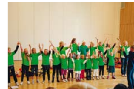
Over: Fra Barnegospelfestivalen

"Du er her i min glede Alltid er du til stede Uansett tid eller sted Du er nær meg Når jeg ber, vil du høre Takk for alt du vil gjøre Uansett tid eller sted Du er nær meg"