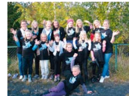
Under: Fra Døgnet